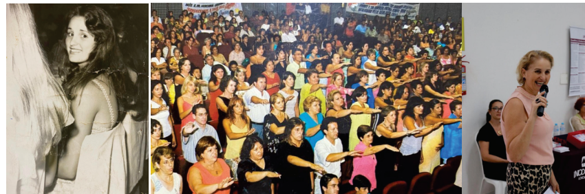
Formatura do magistério Cerimônia de posse dos diretores Eventos na AAPML