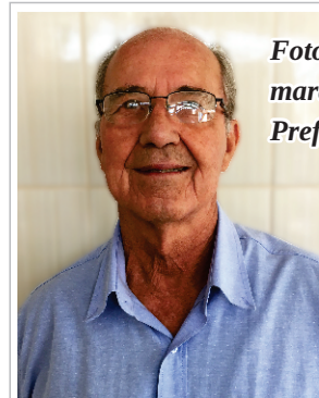
Foto: José Lucinger, 76 anos, marceneiro aposentado da Prefeitura de Londrina