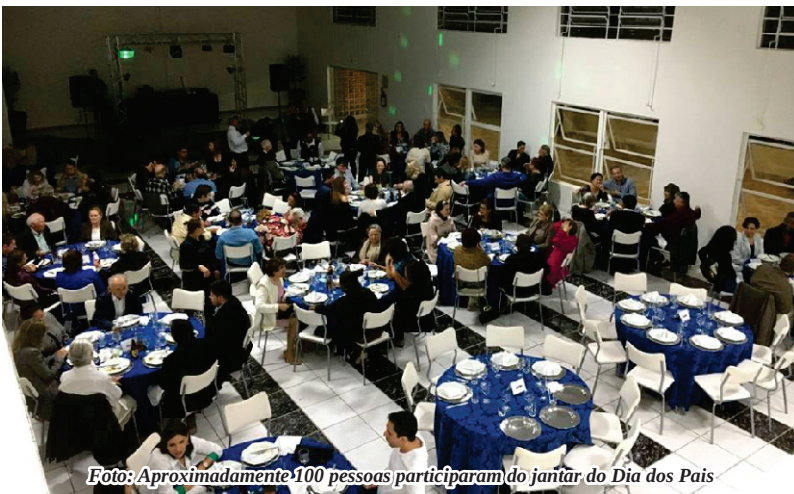
Foto: Aproximadamente 100 pessoas participaram do jantar do Dia dos Pais

O jantar em comemoração ao Dia dos Pais foi realizado no dia 5 de agosto na sede da AAPML. Aproximadamente 100 pessoas compareceram e prestigiaram o show cover do Elvis Presley, realizado por Jeferson Inácio.