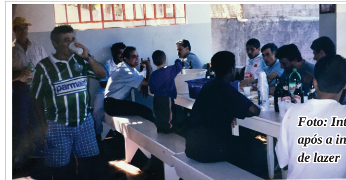
Foto: Intervalo dos funcionários após a inauguração da área de lazer