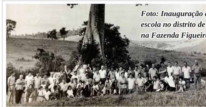
Foto: Inauguração de uma escola no distrito de Guairacá na Fazenda Figueira